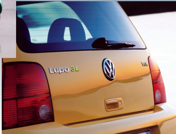
Lupo 3L 1998