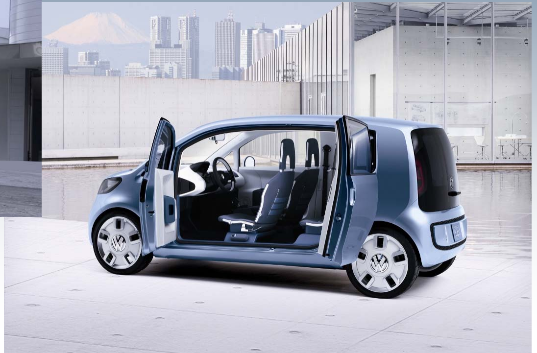
... und der spaceup!