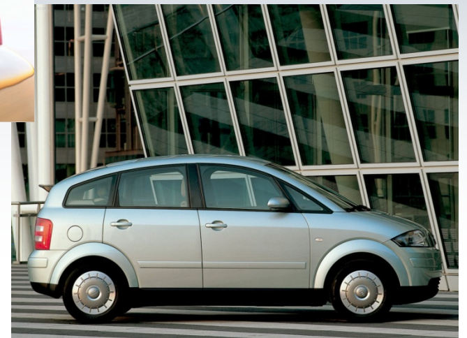
Audi A2 3L 1999