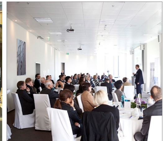
Über 70 Branchen- und Industrie-Cluster in FrankfurtRheinMain