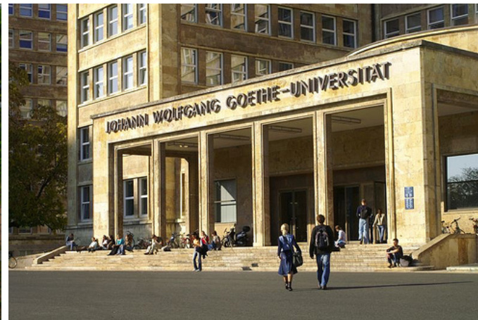
Über 20 Universitäten in FrankfurtRheinMain