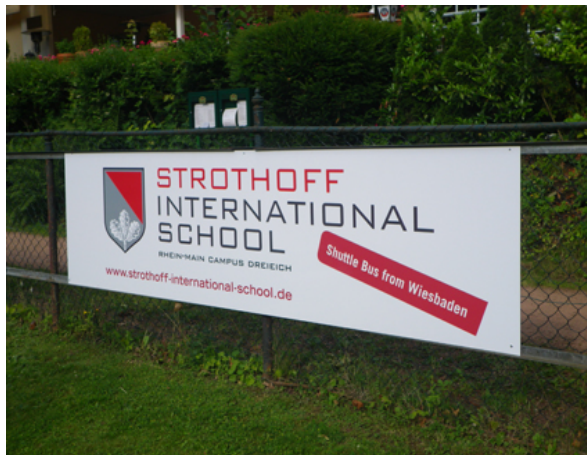
30 internationale Schulen in FrankfurtRheinMain